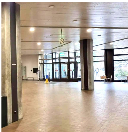
Beleuchtung im Spital