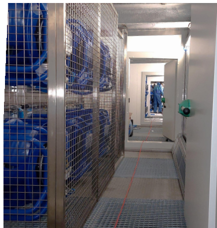
Lüftungsanlage zur Kühlung

Unterstützt durch ProKilowatt unter der Leitung des Bundesamtes für Energie.